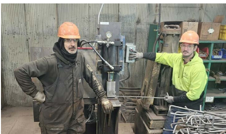
Dobladora de varillas nueva, pág. 7