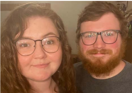
Las caras detrás del taller de máquinas, pág. 5