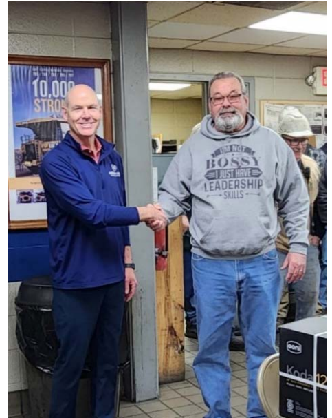
Jubilaciones, pág. 4-5