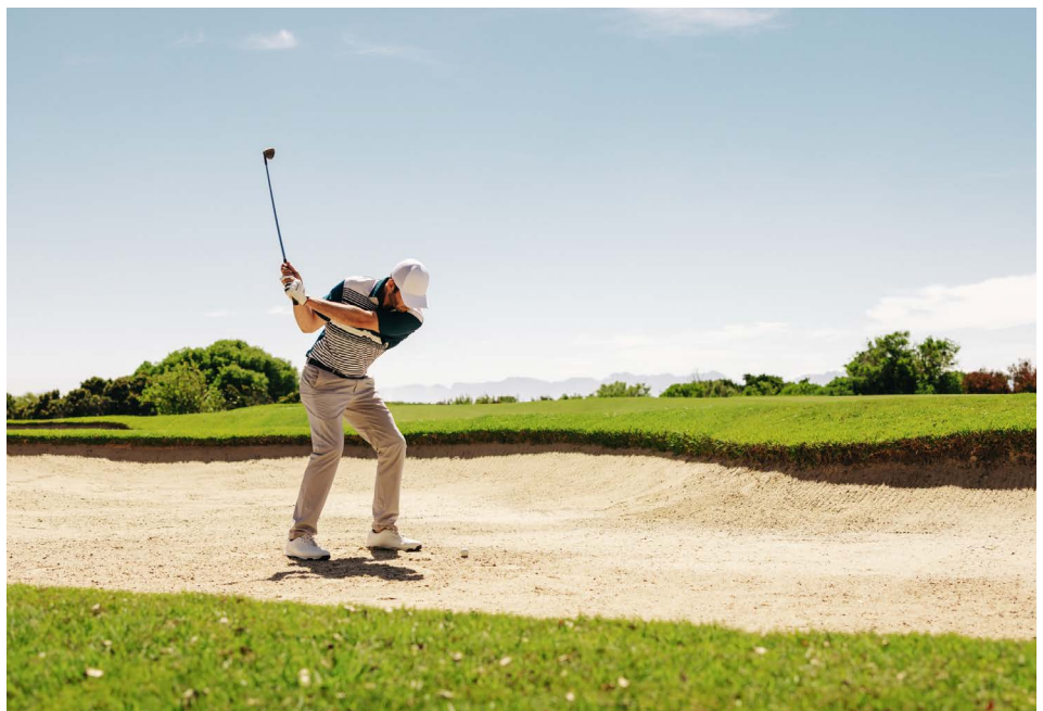
Salida de golf, contraportada