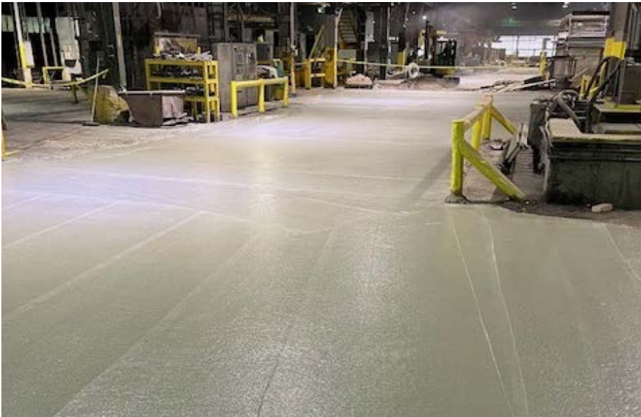
Proyectos concretos, pág. 4